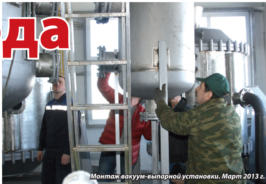
Монтаж вакуум-выпарной установки. Март 2013 г.

Для этого необходимо было укомплектовать цех производства сухой барды вакуум-выпарной установкой, которая решала эту проблему. И уже в конце 2012 года начались работы по реконструкции цеха сушки барды. Была разработана технологическая часть проекта, определены поставщики оборудования, заключены договоры с подрядчиками. С началом 2013 года началась серьезная работа по