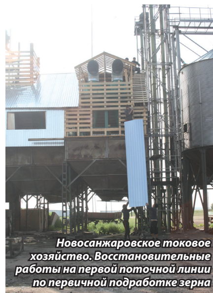
Новосанжаровское токовое хозяйство. Восстановительные работы на первой поточной линии по первичной подработке зерна